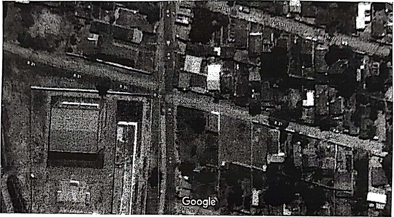
Imagens ©2020 Maxar Technologies, Dados do mapa ©2020 10 m