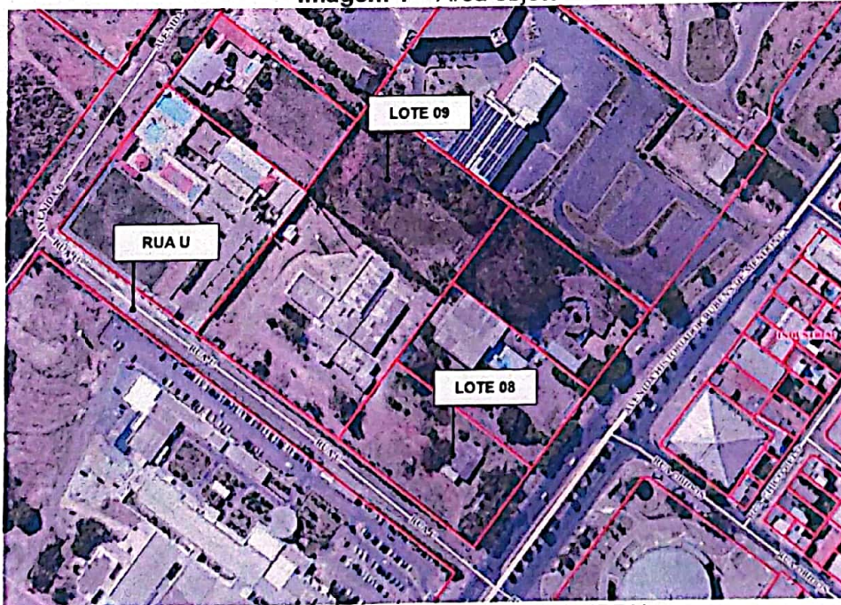
Imagem 1 – Área objeto

Conforme consta nos registros municipais, segue abaixo imagem de satélite, extraída da base SIG-Cuiabá/SMF demonstrando a localização.