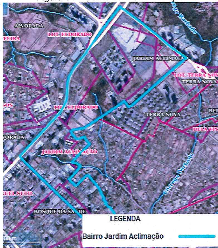
Figura 01 – Bairro Jardim Aclimação.