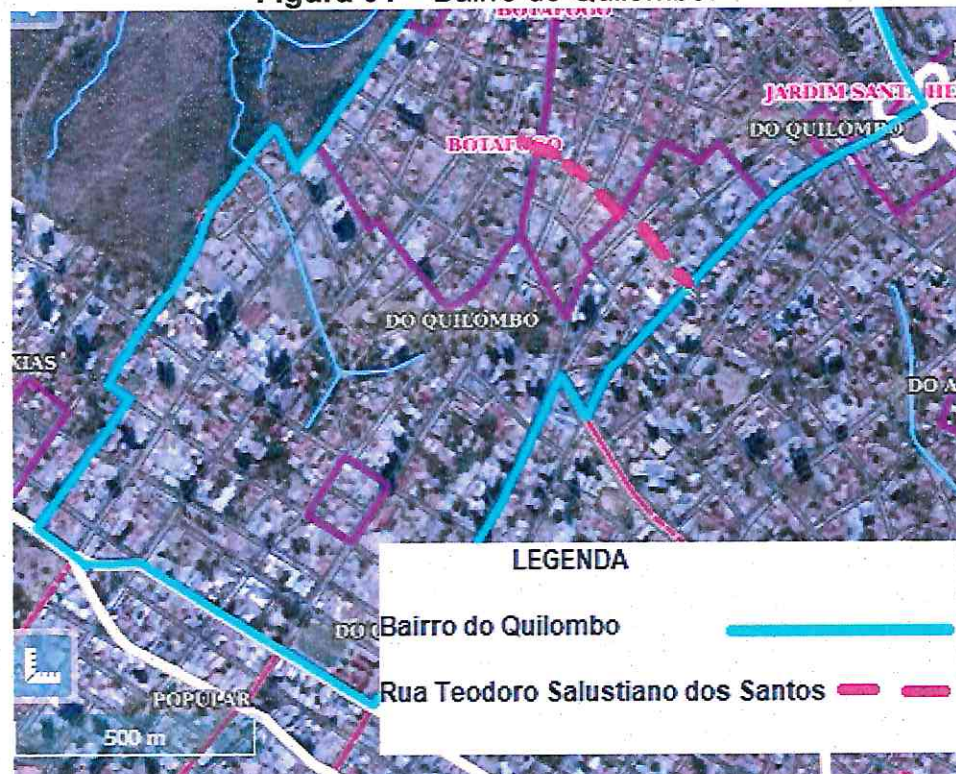
Figura 01 – Bairro do Quilombo.